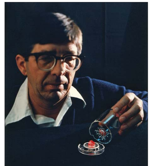
Lodewijk van den Berg met een kristal, ontwikkeld tijdens zijn Shuttle/Spacelab-vlucht in 1985. De elektronische eigenschappen van de kristal zijn op zijn minst twee keer zo goed als die van het beste exemplaar dat op de planeet aarde groeit.

Klopt het dat u met spionage-gevoelig materiaal te maken kreeg?