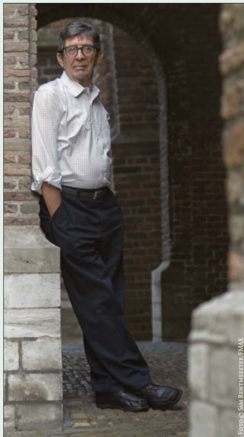
Lodewijk van den Berg, Nederlands eerste astronaut, terug aan de Oude Delft, nazomer 2005: ‘Gewone vliegtuigen? Je wordt ongeduldig. Het gaat zó langzaam.’

“Het meest voel ik me eigenlijk Zeeuw. Waar kom je vandaan; dát is het belangrijkste. Ockels zal altijd een Twent blijven, Kuipers een Hollander. Zeeuwen zijn een speciaal soort mensen. Ze nemen zichzelf minder serieus dan Hollanders. Ze maken eerder grapjes over zichzelf en houden ervan smeulige verhalen te vertellen, die ergens de belachelijke kant van laten zien. “